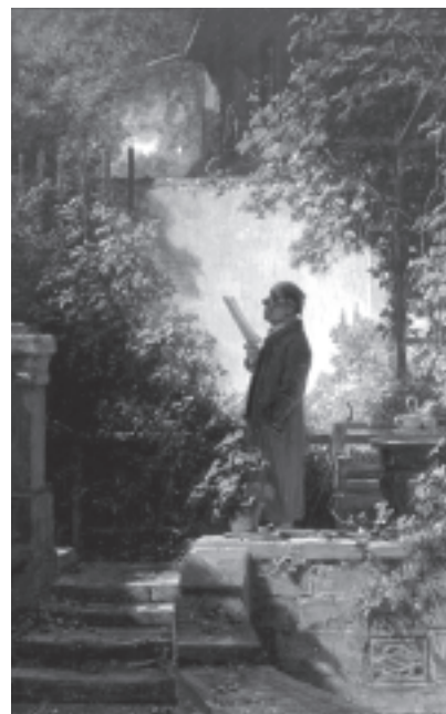
Una delle opere di Spitzweg che verranno esposte a Palazzo dei Normanni

Il suo impero industriale, famoso nel mondo per la produzione di sistemi di fissaggio (chiodi, bulloni e derivati), sembrerebbe avere poco a che fare con l'arte ed, invece, invece è il marchio riconosciuto di una